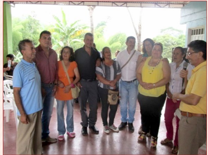
Integrantes de la veeduría del proyecto

Una vez finalizada la socialización del proyecto a las familias beneficiarias, se procedió a conformar la veeduría integrada por líderes de las veredas partici-