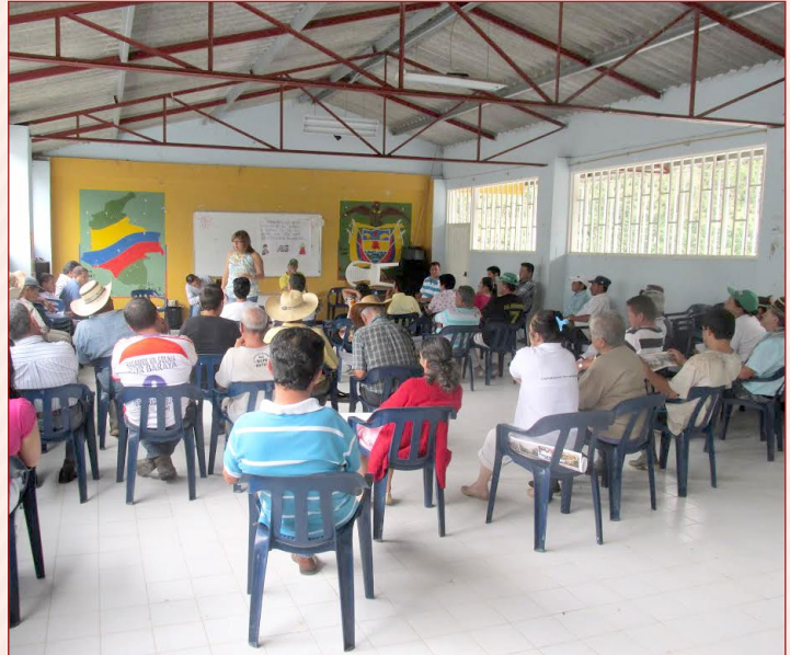
Socialización Optimización Sistema de Acueducto – San Joaquín Municipio de Santa María

En tal sentido, resulta pertinente que la Contraloría institucionalice como estrategia de control social, la Auditoría Visible, como un espacio de participación, donde las comunidades puedan ejercer sus deberes ciudadanos, mediante la vigilancia y control social a la inversión estatal.