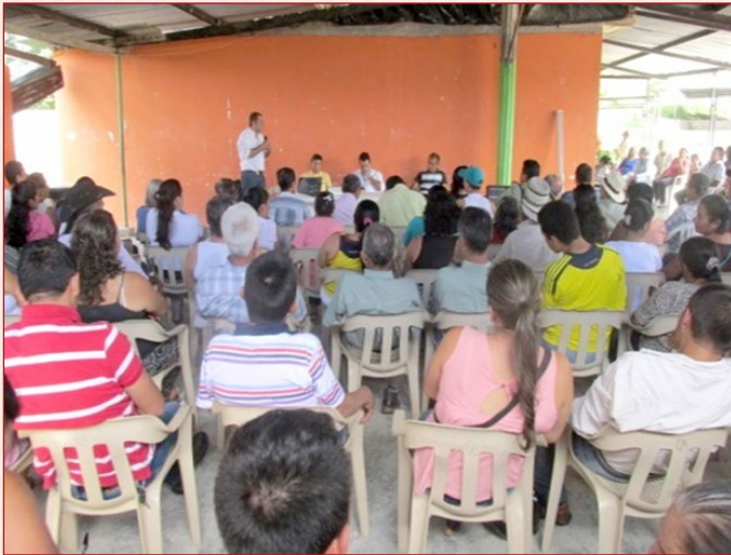
Auditoría Visible Municipio Timaná

En cumplimiento de las actividades previstas, la Oficina de Participación Ciudadana inició en el Municipio de Timaná una Auditoría Visible al proyecto de gas domiciliario para la zona rural del Municipio, el cual beneficiará a 1.050 familias de las veredas: Mateo Rico, Cascajal, Pantanos, Bajo Santa Bárbara, el Diviso y Cosanza, con una inversión del orden de 1.900 millones de pesos, aportados por el Gobierno Departamental, la Empresa ejecutora del proyecto Surcolombiana de Gas S.A E.S.P– Surgas S.A y el Municipio de Timaná.