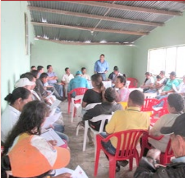
Socialización Gas Domiciliario sector Rural Municipio de Nátaga