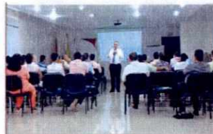
Actividades de capacitación