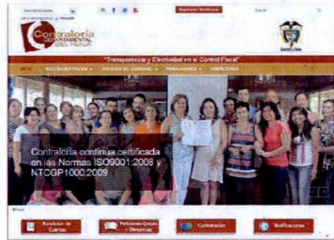
Reingeniería de la página web

"Transparencia y Efectividad en el Control Fiscal"