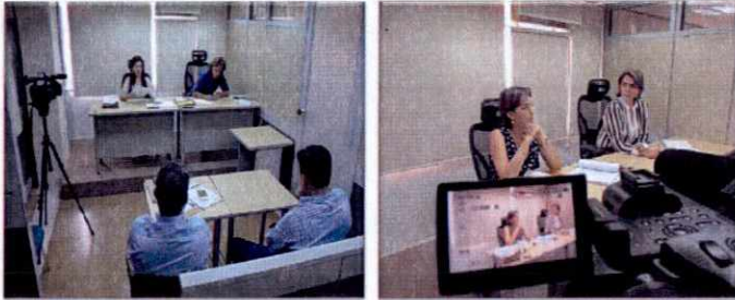
Adecuación Sala de Audiencia Verbal

"Transparencia y Efectividad en el Control Fiscal"